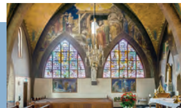
Heilig Hartbeeld van Jezus in noordertransept