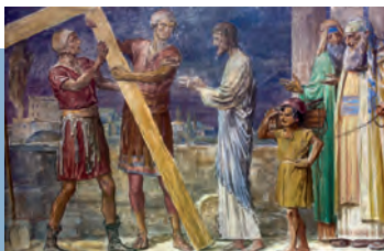
Een van de 14 kruiswegstaties